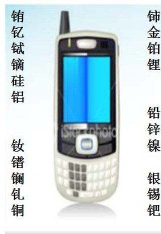
图 1: 一个智能手机中存在的元素

保护资源一直是人类社会的一个主要活动,随着技术的发展,对资源的需求也随之变化。随着工业革命的出现,除了农业商品(如木材,羊毛和棉花)之外,矿产资源和化石燃料的需求急剧增加,当然这些也有很大的政治和环境影响的原因。20世纪工业的进步导致了更大的需求和消费。在21世纪初,资源的需求依然贪婪,事实上已发展到对包括很多稀缺的或者难以取得的元素的需求渴望,当这些资源被使用后,给环境留下一个很大的影响。这些元素中有许多元素没有足够的存储量作为主要开采目标,实际上这些元素是在精制其它矿物时提取的副产物。这些稀缺元素通常在普通矿石中以原子的形式存在,并不是以一个单独的矿物存在,一般是作为杂质存在。举两个例子,一个是碲,是精炼铜的副产品,另一个是铟,与锌和铅矿石同在。一种稀缺元素的可用性,可直接关系到一种日用品的需求。