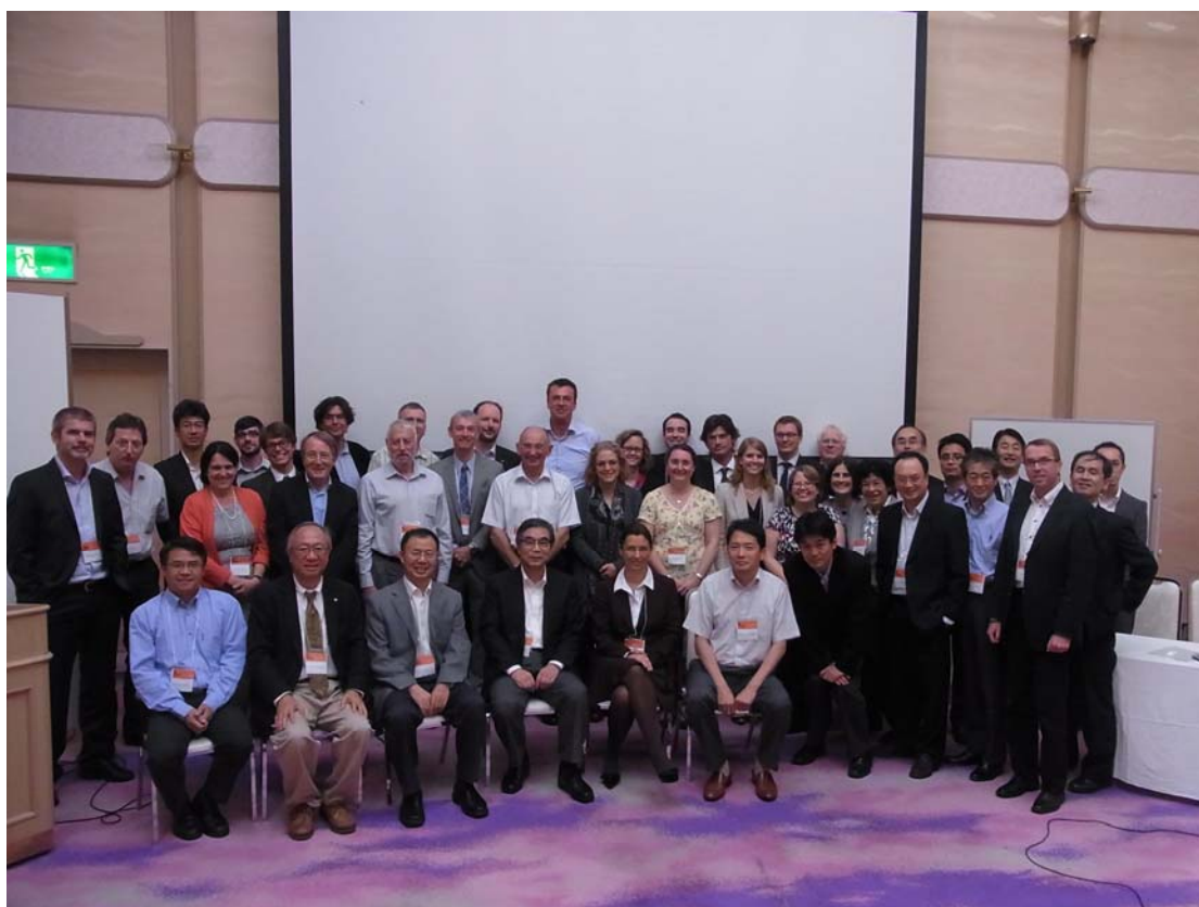
参加 2013CS3 会议的全体代表